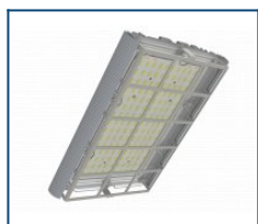
Решётка защитная Unit/Angar D60